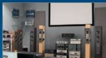
отдельная комната прослушивания